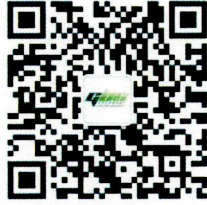
上海市绿色建筑协会